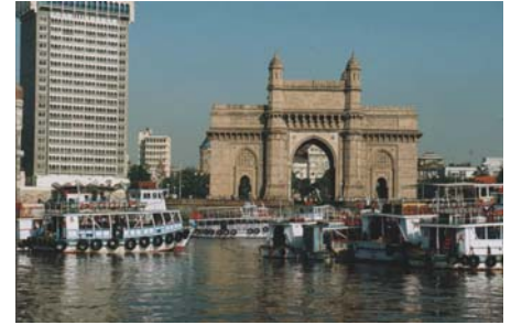
India gate à Bombay